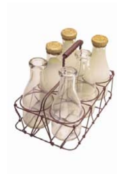
Du lait/ du lolo