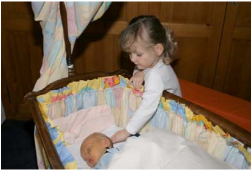
mon p'tit Frère